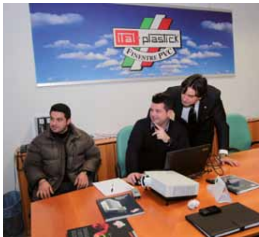
Supporto e formazione aziendale

Il compound impiegato è rigorosamente sottoposto a rigidi test e