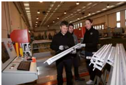
Corso in produzione per il nostro personale qualificato