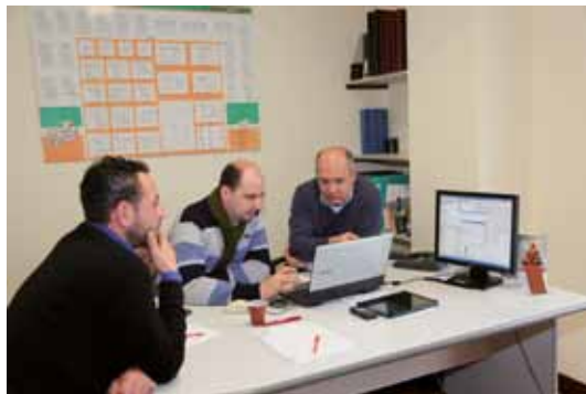
Corso di programmazione